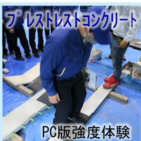
プレストンクリート