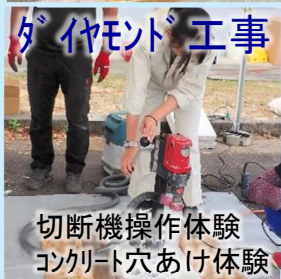
ダイヤモンド工事